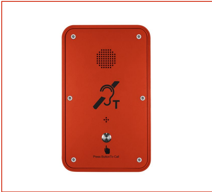
Teléfono resistente a la intemperie